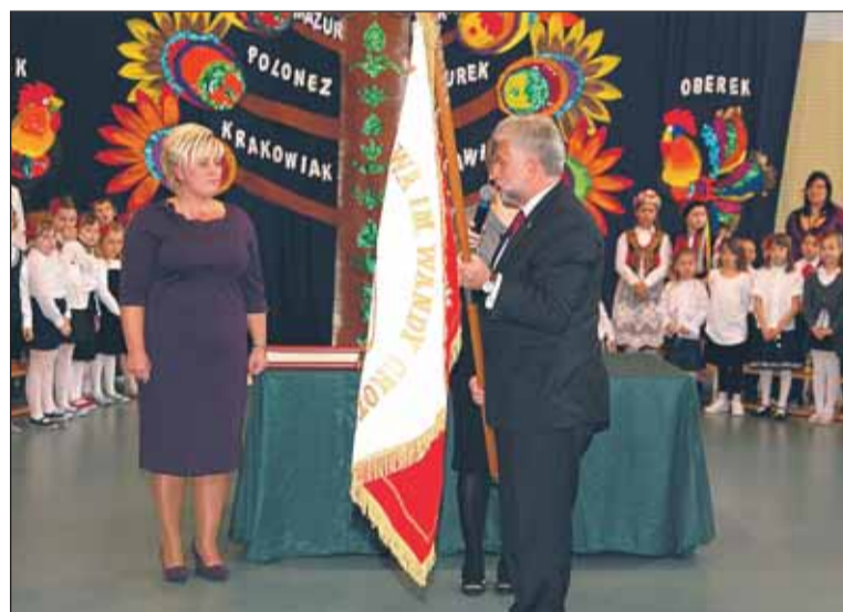
Wójt Gminy przekazuje sztandar Dyrektor Szkoły Podstawowej w Józefowie