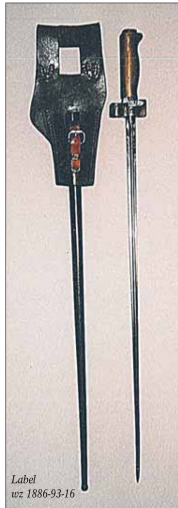
Label wz 1886-93-16