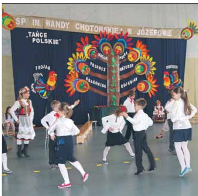
Dzieci tańczą krakowiaka