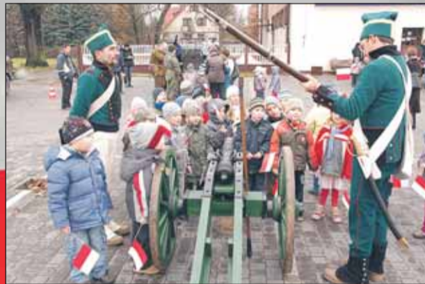
Stowarzyszenie Arsenal – wybuchy armaty