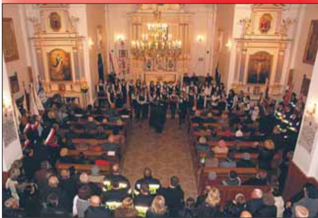
Msza za Ojczyznę w kościele parafialnym w Nieporęcie