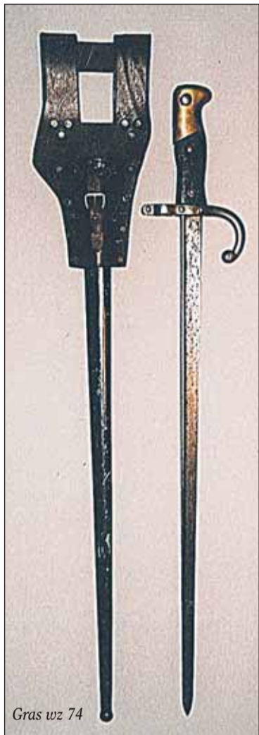
Gras wz 74