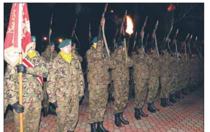
Salwa honorowa I Warszawskiej Dywizji Zmechanizowanej w Legionowie