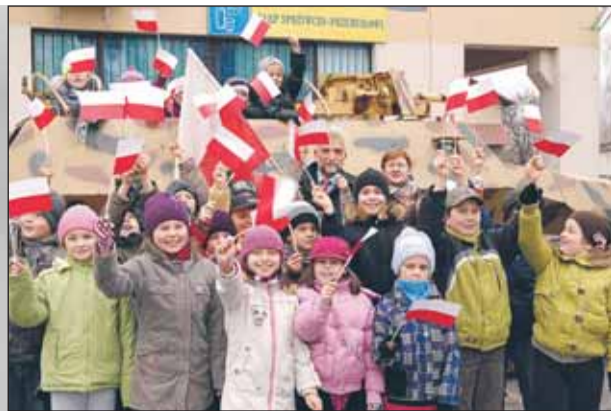
Przejażdżki wozami bojowymi na Placu Wolności

Obchody Święta Niepodległości zgromadziły na Placu Wolności w Nieporęcie wielu mieszkańców. Poranna prezentacja sprzętu wojskowego, przejażdżki wozami bojowymi i armatnie strzały stanowiły największą atrakcją dla najmłodszych. Podczas wieczornych, oficjalnych uroczystości, odsłonięta została tablica poświęcona pamięci Mieszkańców gminy Nieporęt – żołnierzy Armii Krajowej.