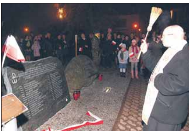
Poświęcenie pamiątkowej tablicy