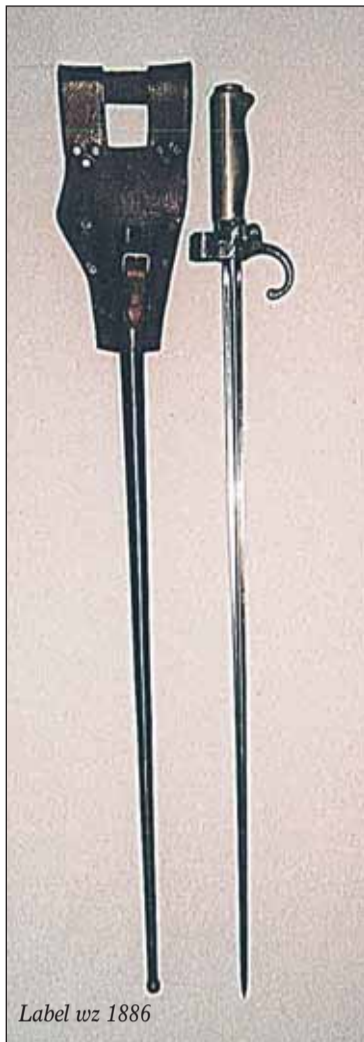
Label wz 1886