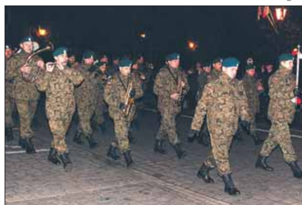
Orkiestra Garnizonu Siedlce