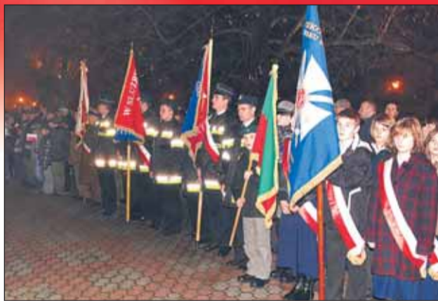
Uroczystości na Placu Wolności, poczty sztandarowe szkół i Ochotniczych Straży Pożarnych