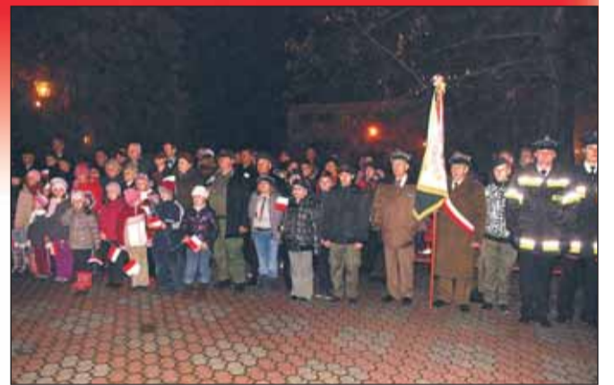
Uroczystości na Placu Wolności