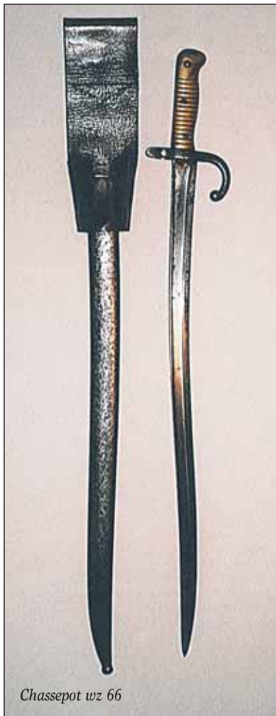
Chassepot wz 66