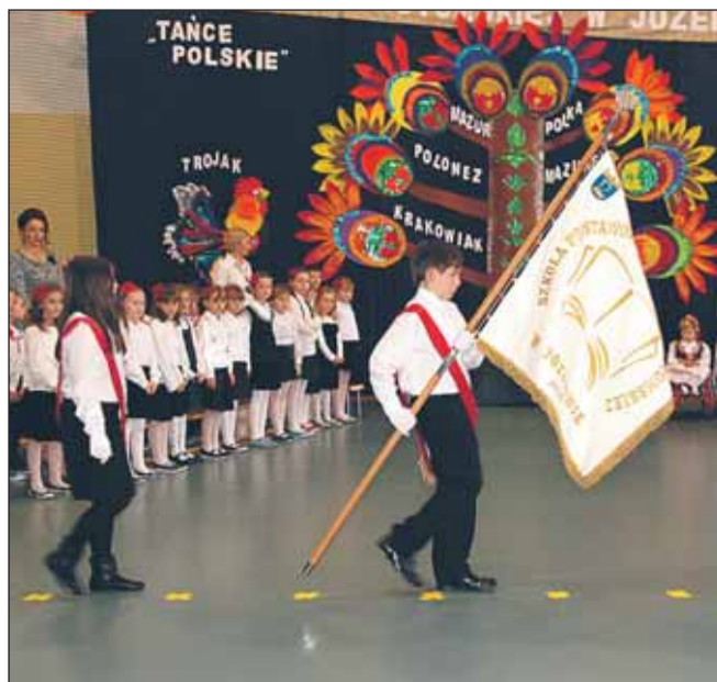
Uroczyste przekazanie sztandaru