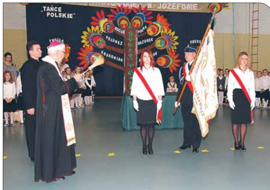
Poświęcenie sztandaru szkoły przez biskupa Kazimierza Romaniuka