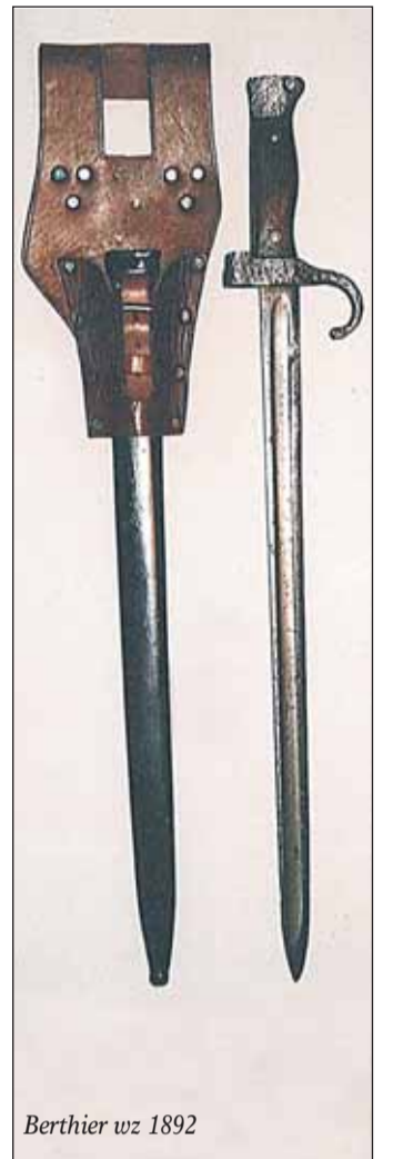
Berthier wz 1892