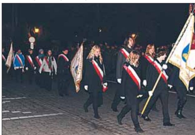
Defilada pocztów sztandarowych