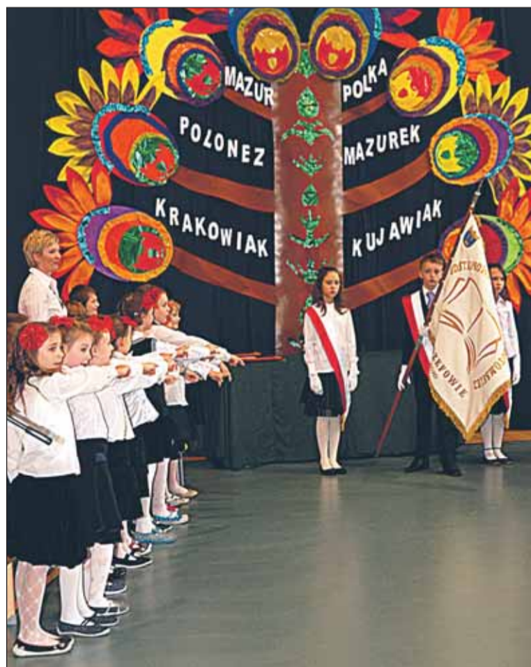
Ślubowanie uczniów klas pierwszych